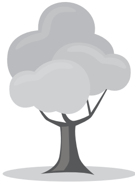
а) на залез слънце