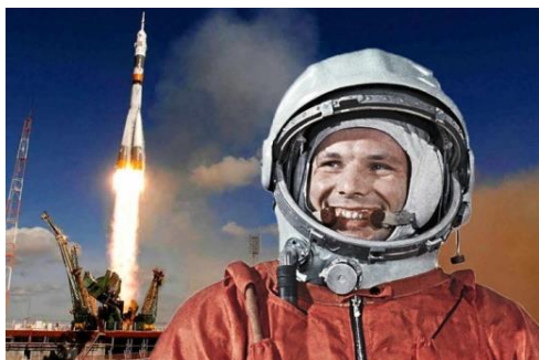
Юрий Гагарин Първият човек полетял в Космоса

Затова 12 април се отбелязва като Международен ден на Авиацията и космонавтиката .