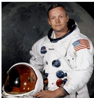
Нийл Армстронг Първият човек стъпил на Луната